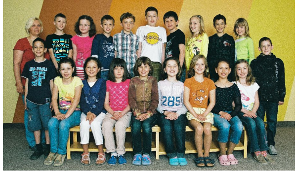
ZŠ R. Frimla 2009 - 2010