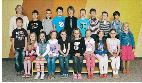
ZŠ R. Frimla 2009 - 2010