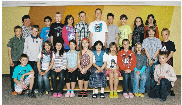
ZŠ R. Frimla 2009 - 2010