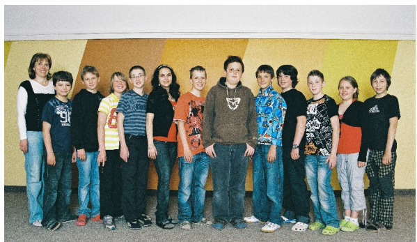
ZŠ R. Frimla 2009 - 2010