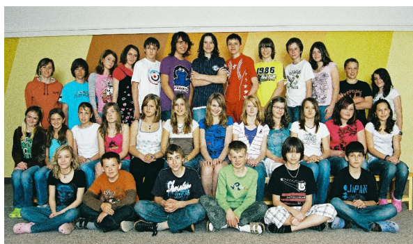
ZŠ R. Frimla 2009 - 2010