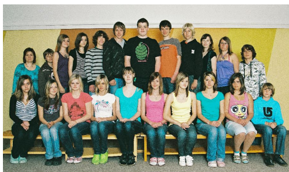
ZŠ R. Frimla 2009 - 2010