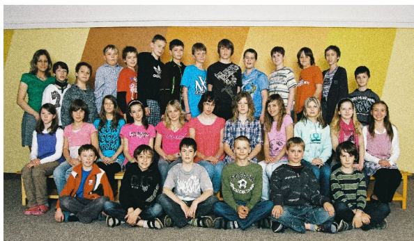
ZŠ R. Frimla 2009 - 2010