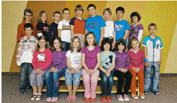
ZŠ R. Frimla 2009 - 2010