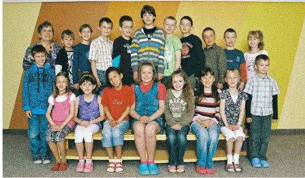
ZŠ R. Frimla 2009 - 2010