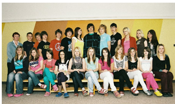
ZŠ R. Frimla 2009 - 2010