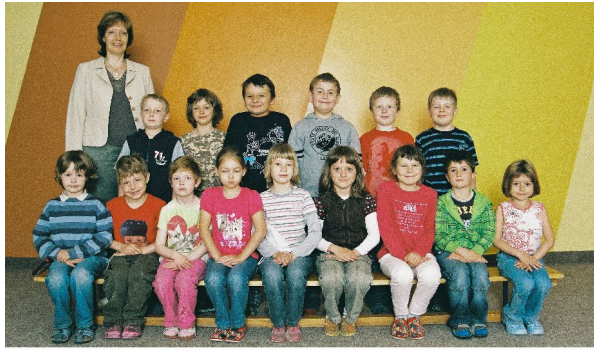
ZŠ R. Frimla 2009 - 2010